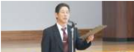
年頭に当たっての校長先生の話