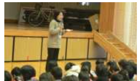
風邪の予防についてのお願い

今週は、交通立番指導週間です。各ポイントに全教師が立ち、児童の安全な登校を現場指導しています。