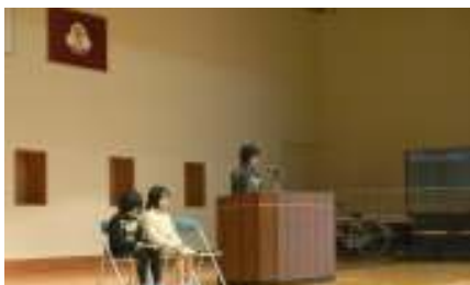
児童代表による新年の抱負

「まだ、時間がある」「後で考える」「明日からやる」ではなく、今から、今日から即実行し有意義に過ごして下さい。』