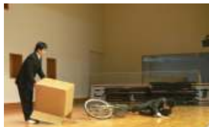
自転車事故防止のポイント

「早寝・早起き・朝ご飯を守る」「発表を多くし、作文コンクールに挑戦する」「きちんと勉強し、丈夫な体で、思いやりのある6年生になる」等、今年の実践的な目標を堂々と述べることができました。