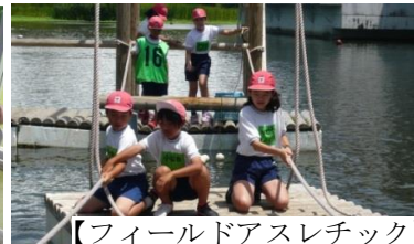
【フィールドアスレチック】